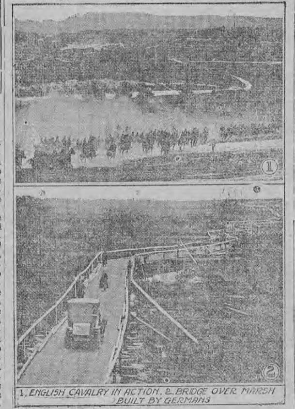
1. ENGLISH CAVALRY IN ACTION. 2. BRIDGE OVER MARSH BUILT BY GERMANS

En el grabado superior se ve la caballería inglesa que galopa en el Norte de Francia a fin de atraer el fuego de la artillería alemana y descubrir la posición de sus baterías. El otro grabado muestra un puente tortuoso de madera construido por los alemanes sobre un pantano. Este puente tiene 1,630 de largo y 600 alemanes lo construyeron en cinco días. Este puente es suficientemente fuerte para permitir el paso de un cuerpo entero de ejército.