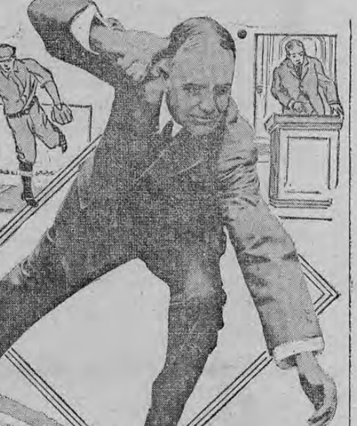
Billy Sunday is tearing loose, to use his own expression, in this city, and the inhabitants are being treated to fifty-seven varieties of evangelistic religion. Thousands are attending his revival meetings, as they did in Philadelphia and elsewhere throughout the country where Sunday has appeared. This former professional baseball player is attracting heaps more attention than congress. His sensational methods of preaching, his queer antics on the platform and his use of slang and uncouth expression put him in a class all by himself. He's the most talked about evangelist in the country today.